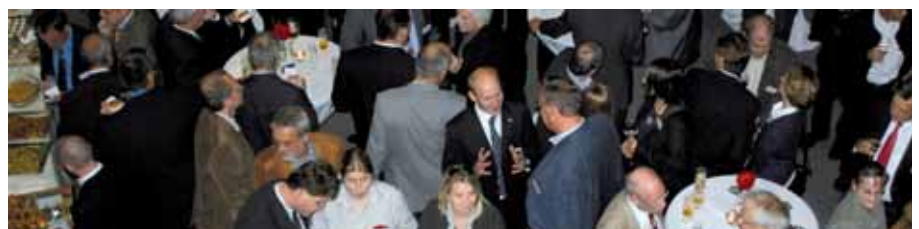
Get-together beim EDV-Gerichtstag

Diese und weitere Veranstaltungen finden Sie auch unter www.juris.de/Veranstaltungen